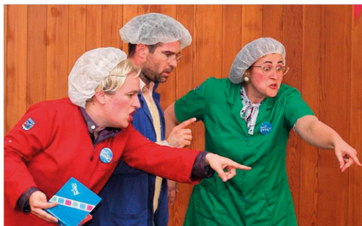
Le spectacle "Tout pratic.net" de la compagnie Artiflette a ravi et captivé les enfants.

La compagnie du plateau des Petites-Roches "Mielles et compagnie" a reçu mercredi la troupe de l'Artiflette dans l'ancienne mairie de Saint-Hilaire, pour une unique représentation baptisée "Pratic.net".